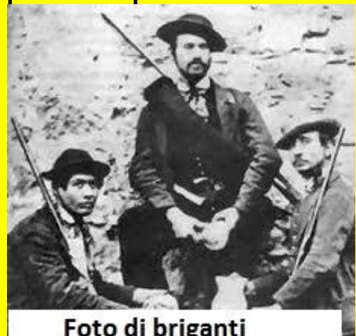
Foto di briganti

della repressione di un esercito italiano (o piemontese) contro un popolo in rivolta: in effetti si trattò anche di una specie di guerra civile fra i borghesi, tutti o quasi ormai solidali con il nuovo assetto sabauda che meglio tutelava i propri interessi contro un mondo contadino in rivolta. In questo contesto Carmine Crocco colse la sua occasione. Le bande dei briganti si ampliarono e diffusero oltre ogni limite precedente: Crocco arrivò ad avere al suo comando più di tremila uomini e controllare