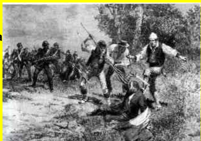
Morte di Pisacane presso Sanza

detenuti di cui solo alcuni erano politici e con essi sbarcò a Sapri.