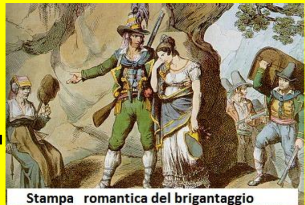
Stampa romantica del brigantaggio

Cominciamo ad esaminare quella di Pisacane partendo dalla versione più conosciuta, quella de "la Spigolatrice di Sapri".