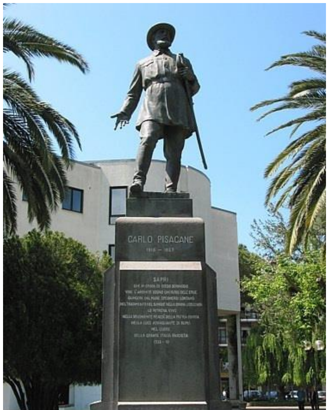
Sapri : monumento a Pisacane

Eran trecento, eran giovani e forti, e sono morti!