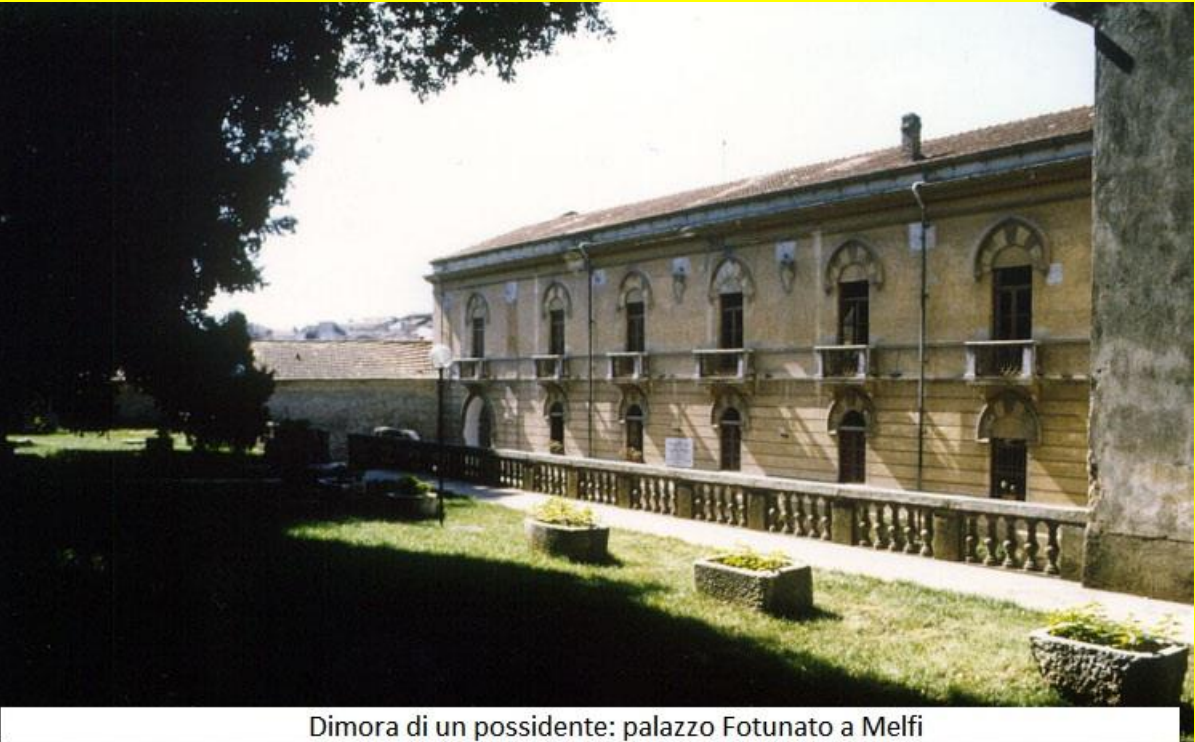
Dimora di un possidente: palazzo Fotunato a Melfi

ese e si diffe ndev a sopr attutt o per iscrit to. l' Italia contad in a parla va solo diale